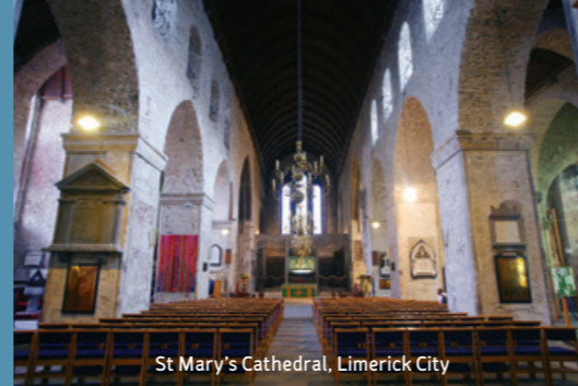
St Mary's Cathedral, Limerick City