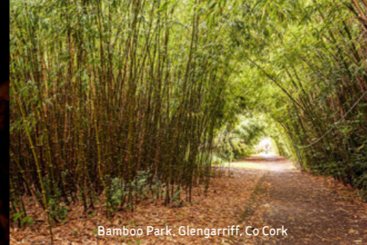
Bamboo Park, Glengarriff, Co Cork