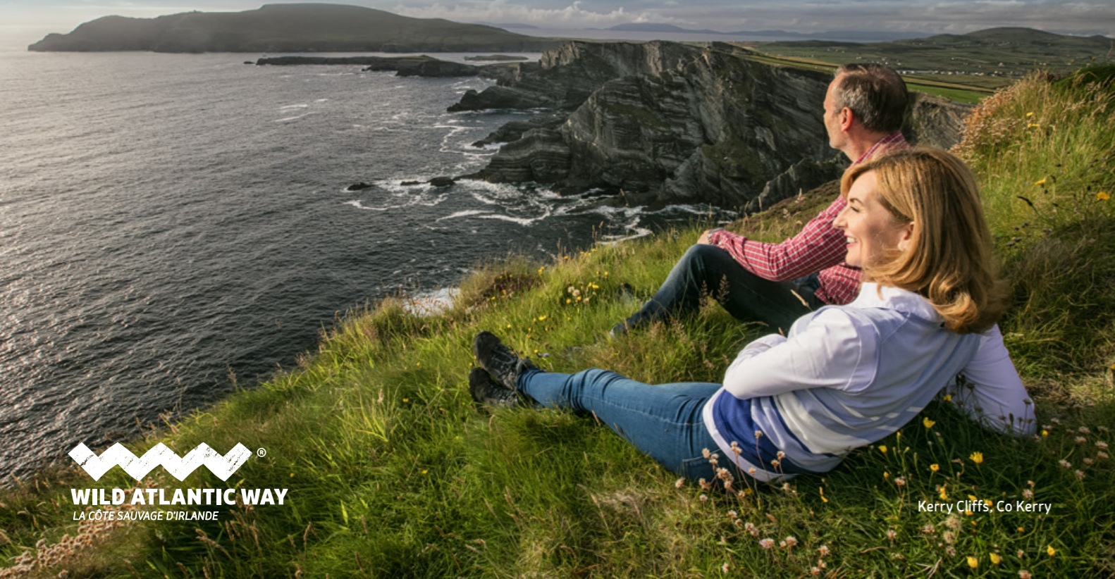
Kerry Cliffs, Co Kerry

jambes et casser la croûte, ce qui vous permettra de prendre votre temps sur la route afin de bien profiter du spectacle. Les gastronomes pourront même s'essayer à la pêche aux crustacés en compagnie d'un guide local aux talents culinaires certains, ce qui leur permettra de goûter avec d'autant plus de plaisir ensuite au produit de leur pêche. La nuit tombée, vous pourrez faire la fête au gré des concerts de musique traditionnelle, et pourrez même vous essayer à faire quelques pas de danse irlandaise ! C'est ici, aux confins de l'Europe occidentale, que, attirés par le rugissement régulier de l'océan et par la chaleur accueillante des habitants, vous trouverez l'Irlande dont vous avez toujours rêvé.