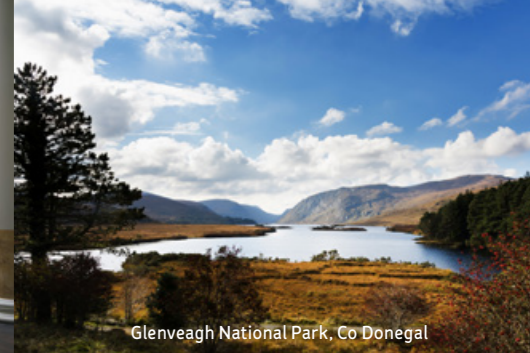
Glenveagh National Park, Co Donegal