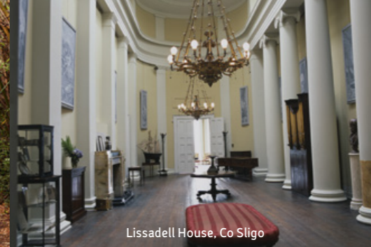
Lissadell House, Co Sligo