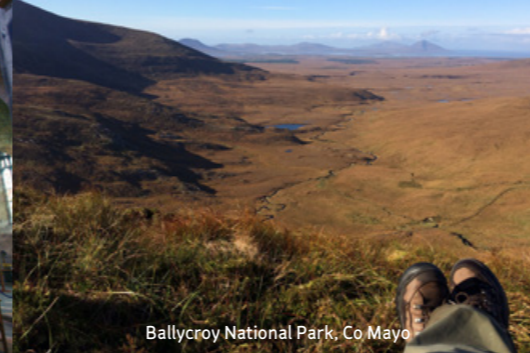
Ballycroy National Park, Co Mayo