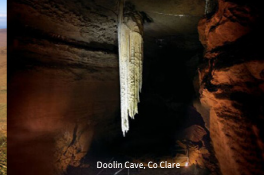
Doolin Cave, Co Clare